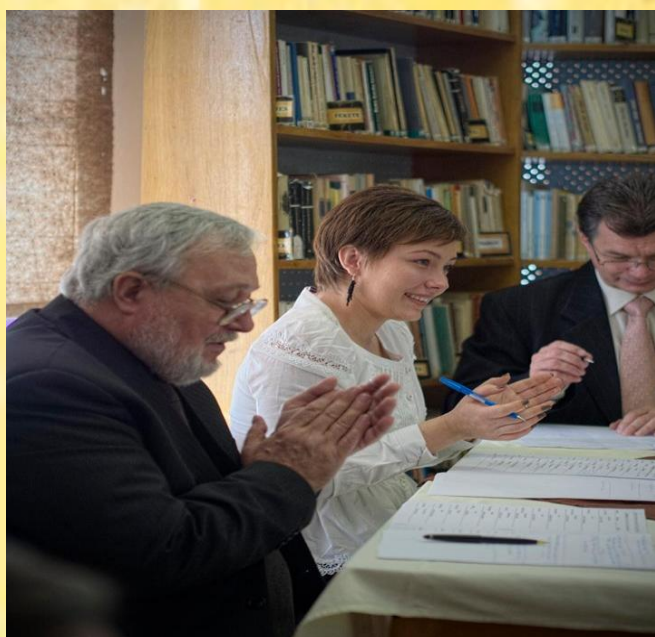
A zsűri tagjai