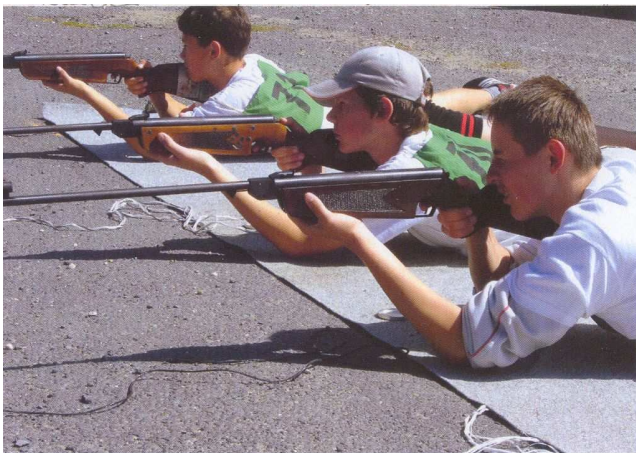
Strelba na obľomí brá - dnuvrtka