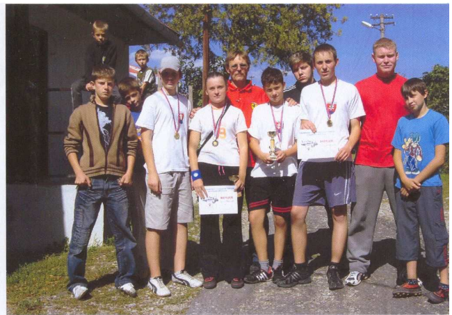
Memora ZO ZBTČ - Príbelce